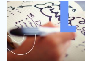
Berufsfelder im Sport kennen lernen

Theorie: Organisation von Sportveranstaltungen, Beispiel WM und Olympische Spiele kennen lernen, ein Sportprojekt am ASG Praxis: wir messen uns in Fitness