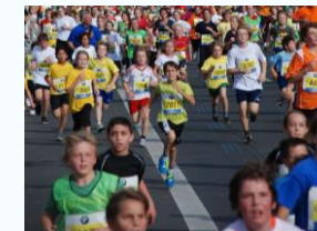
Mini Marathon am 26.09.2020 über 4,2195 km

Theorie: Spieltheorie, Spielideen, Spielregeln Praxis: Große und Kleine Spiele, neue Spiele entwickeln