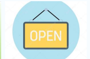
Abschlussprojekt selbst organisiert