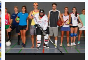
Sportspiele und Kleine Spiele