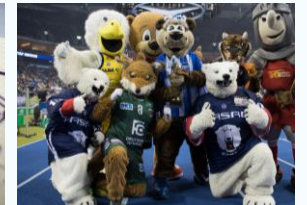
Gesundheits-, Freizeit- und Leistungssport